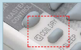
Función secado interno.