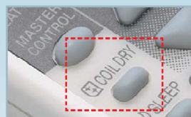
Función secado interno.