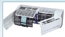
Sistema de apertura en ventana.