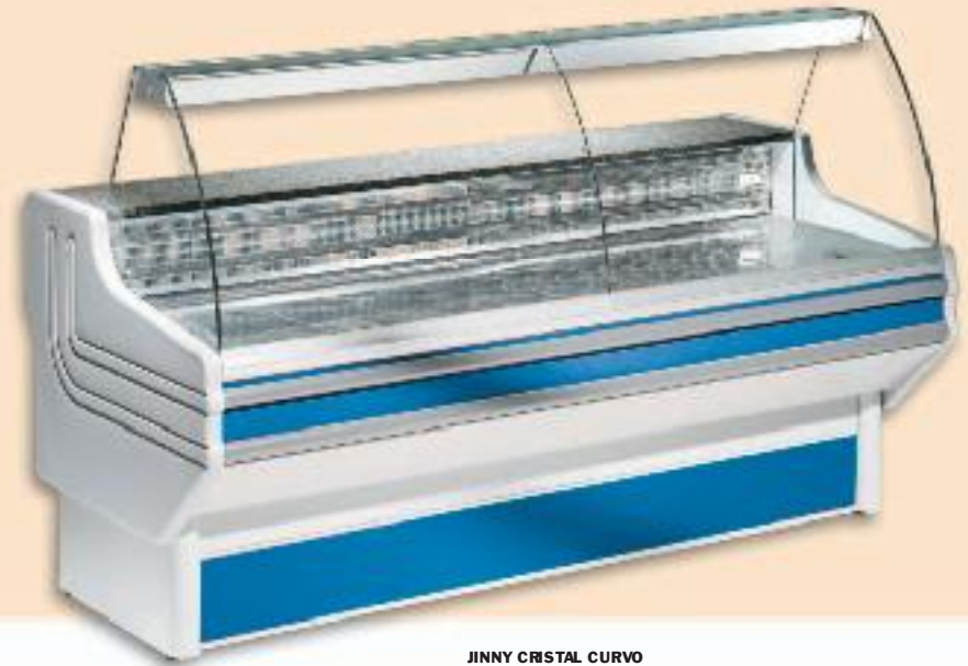
JINNY CRISTAL CURVO