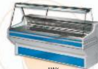
JINNY CRISTAL RECTO