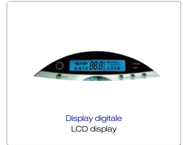
Display digitale LCD display